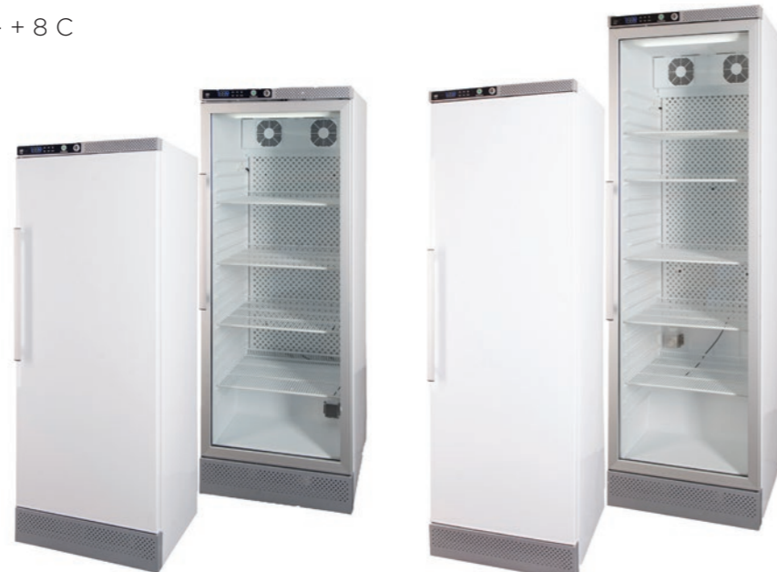
AKG – AKS 337