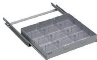
Låda med fack/ avdelare